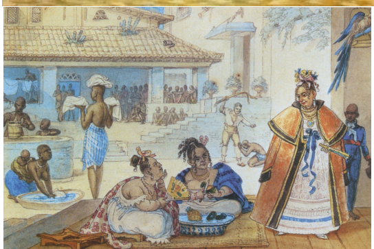
Imagens do Brasil cerca de 1820. Obras de Jean Baptiste Debret (1768-1848).